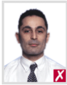
โกล้เกินไป