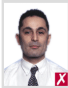
โก่งเกินไป