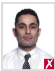
ใกล้เกินไป