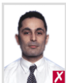
โกลเกินไป