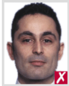
ใกล้เกินไป