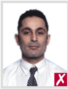
โก่งเกินไป